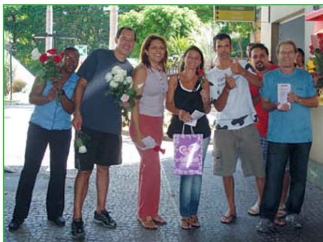
Comemoração do Dia da Mulher, março de 2010

“Você já foi ousada, mulher; não permita que a amansem”. Isadora Duncan, bailarina